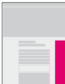
banner v obsahu na pravé straně