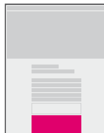
banner v obsahu uprostřed