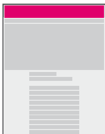
banner nad obsahem (leaderboard)