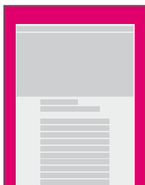
banner v pozadí (obrandování)

Vysoce viditelné pozice přímo v obsahu. Pozice jsou exkluzivní a rezervované pro jednoho inzerenta.