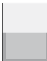
1/2 na šířku